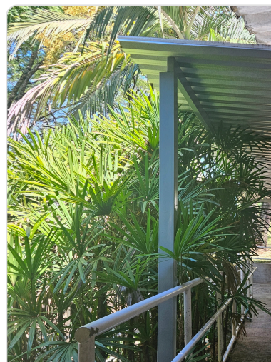
Cobertura na rampa d Prédios 15 e 16 n